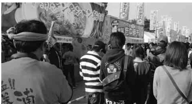
出展ブースに並ぶ行列の様子