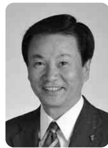
千葉県知事 森田 健作