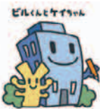
経済センサスキャラクター

平成24年2月1日に実施する、経済センサス-活動調査は、我が国における産業構造を包括的に明らかにすることを目的とする政府の重要な調査で、統計法に基づいた報告義務のある基幹統計調査です。