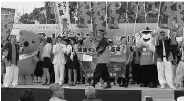
ステージでの勝浦市PRの様子

本グランプリには全国の29都道府県から過去最多の63団体が参加し、2日間での会場来場者の総数は50万人を超えました。 千葉県からは勝浦市商工会の「熱血!!勝浦タンメン船団」が過去の大会を通じて、県勢初となる出場を果たしました。 料理の味はもちろん、地域をPRするパフォーマンスやおもてなしなどを総合的に評価したグランプリ投票結果では、勝浦市商工会の「熱血!!勝浦タンメン船団」は第7位、関東で唯一10位以内入賞の大健闘となる成績を取めました。 来年の第7回大会は福岡県北九州市で開催されることが決定しています。