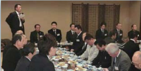
1月18日 賀詞交歓会（海鵬荘）