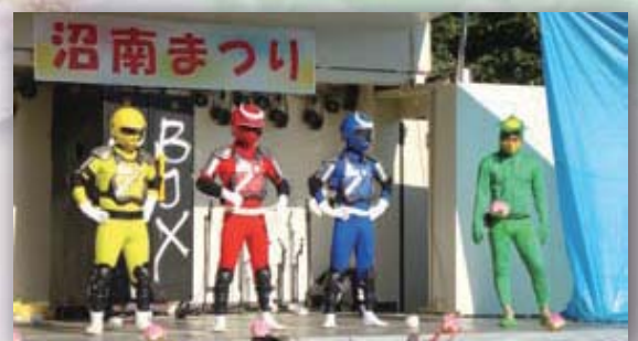
沼南まつりテガレンジャー出演