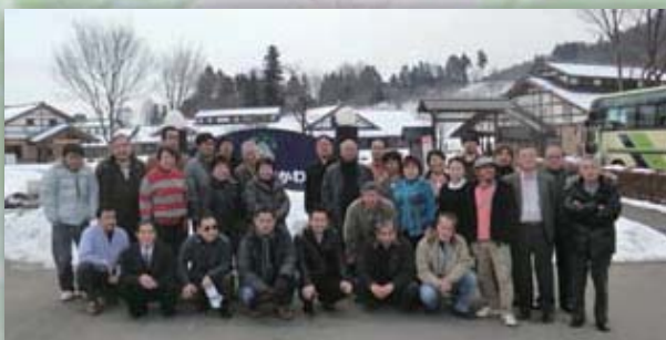
2月5・6日 会員旅行（老神温泉）