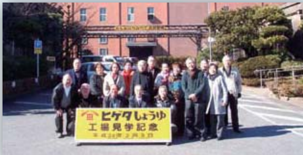
2月9日 視察研修（ヒゲタ醤油）