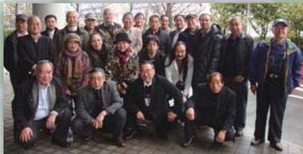
3月9日 建設・工業部会合同視察研修（東京ビックサイト）