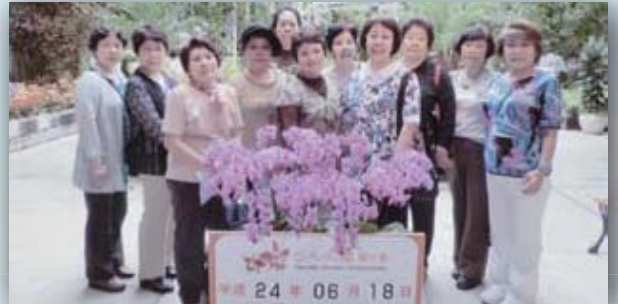
6月17・18日 一泊旅行（伊豆）