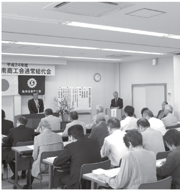
柏市沼南商工会役員名簿