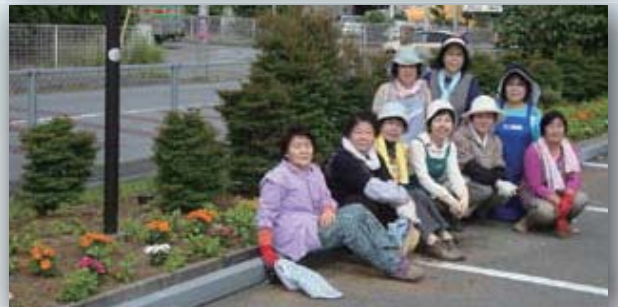
商工会館の花の植え替え