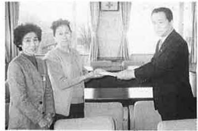
2月14日県婦連幹部が日赤を訪問し、募金を贈呈

平成5年度県婦連では、「ふれあい募金運動」を推進しました。 この運動は、社会一般の福祉の増進に資する事業の一環として推進したものであり、 その結果、県下各地で積極的な募金運動が展開されました。この寄せられた募金は、日赤千葉県支部へ100万円を寄付し、残金は、緊急災害発生時に備えることになりました。