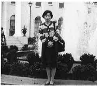
ウィスコンシン州知事公邸にて