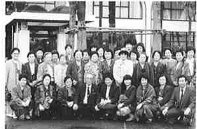
富津市富津商工会婦人部の皆さん 県内視察研修 館山「いこいの村」にて