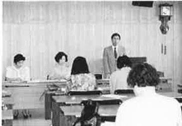
三町合同視察研修で東伊豆町商工会を訪問

今後も、青年部や他団体とともに活力ある街づくりを求め、婦人部らしい活動を積極的に展開して行きたいと思っております。