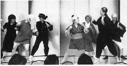
ユーモアあふれる踊りを披露した芝山町の皆さん

この発表会は、商工会活動の重要な担い手である商工会婦人部の交流と部員相互の親睦を図り、商工会婦人部の一