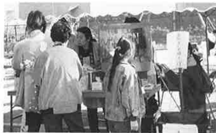
「ふるさとふれあいまつり」に参加の大栄町商工会婦人部

動を熱心に行いました。また、近隣の下総町や神崎町商工会婦人部との合同事業（先進地視察、講演会等）にも積極的に取り組み親睦と交流を深めているところでもあります。