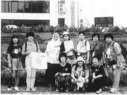
ワークショップの会場にて

ピックスタジアムへ、色とりどりの民族衣装を着た各国の人達と厳重なボディチェックを受けて入場、やっと自分達の席をみつければ腰を下してまわりを見渡した時にはほぼ満席で「ああ私もこの北京の会場で世界人達と一諸に開幕式に参加することが出来たんだ」と感無量でした。そして又、こんなにも多勢の人達が自分達の為、そして自国の為にと旅費をかけ時間をさいて参加しているのだと。最後にアフリカで点火された平和のトーチが会場へ到着、平和発展平等の人文字と共に全員に用意されたスカーフを振りまき女性のパワーが最高潮に達し幕は閉じました。私達も県の代表としてせっかくのチャンスなので見て聞いてだけでなく参加してはと言うことで平