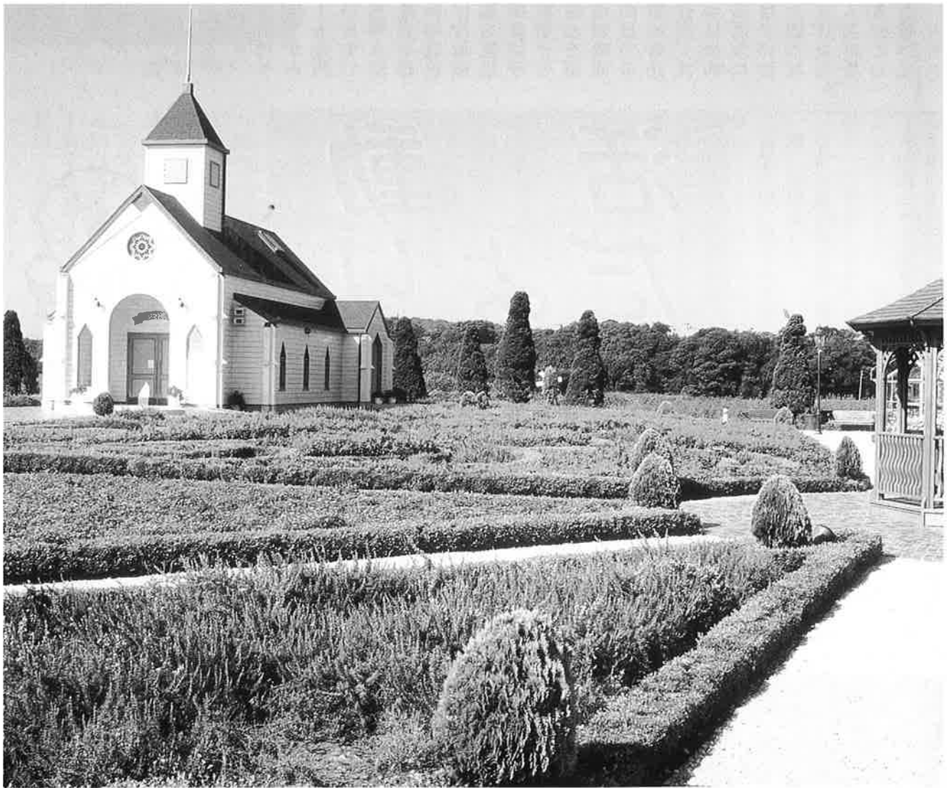
〔ローズマリー公園〕

今年年間120,000人の観光客が訪れる南房総の観光名所「風車とローズマリーの里・まるやま」