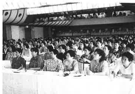
熱心に聴講する参加者の皆さん

平成7年8月24日(木)、千葉市内のホテルにおいて、千葉県商工会婦人部正副部長研修会が開催され、県下61商工会婦人部から111名の各婦人部正副部長等が出席されました。 当日は、神奈川県津久井町