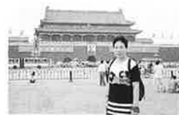
天安門前広場にて筆者

第四回世界女性会議（NGO）に参加させて戴きました。千葉県としては、初めての参加の為暗中模索の状態で出発しました。中国で開催されることは、アジアの国々にとっても初めてのことで、北京空港へ到着すると女性会議の為に特別のゲートも用意されておりスムーズに入国できました。この会議の目的は女性の地位向上の為、平等・開発・平和への行動をスローガンに開催された会議です。一八五ヶ国の政府代表として二〇〇〇以上のNGOの代表三六〇〇〇人の参加で会議は開かれました。私達が参加しました開幕式の一部を紹介いたします。式は夕方からと言うことで、午前中市内見学昼食を済ませ着替えて、ホテルで用意した専用のバスに他からの参加者と同乗一路会場となるオリン