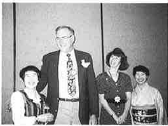
ホストファミリーとサンキューパーティーにて

また、様々の分野で活動している素晴らしい団員との出会いや行動を共にしながら友情を高め合えたことも大きな成果です。この貴重な体験を今後の活動の場に生かし、21世紀に向けて大きな輪を広げたいと思います。