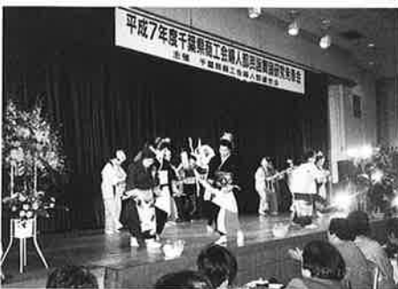
見事な踊りを疲労した八日市場の皆さん

この発表会は、婦人部の交流と部員相互の親睦を図り、一層の団結を促すことを目的に県婦連の主要事業として毎年実施されております。今年度も、舞踊、カラオケ等を中心に49曲が演じられ、日頃の練習成果を披露いただきました。