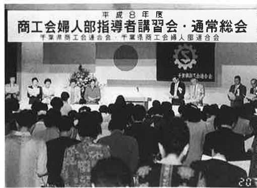
▲総会で「婦人部誓いの言葉」を全員で読み上げる

五月二十日、千葉県商工会婦人部連合会の平成八年度通常総会と指導者講習会が鴨川市内のホテルで開催され、県下63商工会婦人部から290名の婦人部員が出席した。