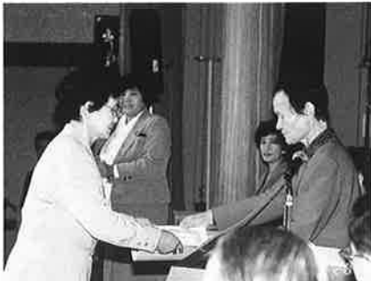
▲活発な活動の新人部員に対し表彰

五月二十日、千葉県商工会婦人部連合会の平成八年度通常総会と指導者講習会が鴨川市内のホテルで開催され、県下63商工会婦人部から290名の婦人部員が出席した。