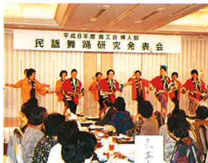
▲夷隅ブロックの「ドンバン節」

制限があったので、例年より参加者は少なかったが、特別にわたって舞踊、カラオケ、合唱、寸劇、太鼓と腕前が披露され、和やかな雰囲気のうち幕を閉じた。