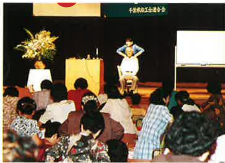
▲「ツボはここですよ！」浪越先生