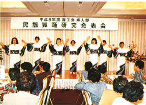
▲東庄町の舞踊「東庄音頭」