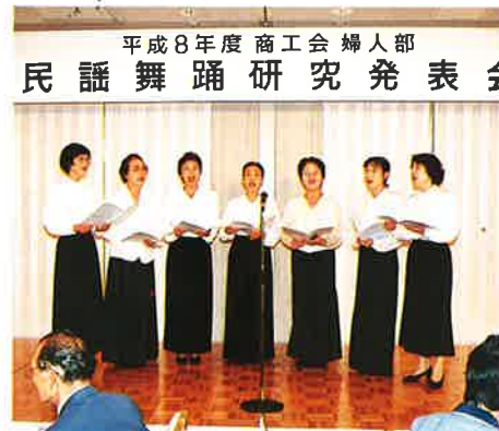
▲横芝町の二部合唱