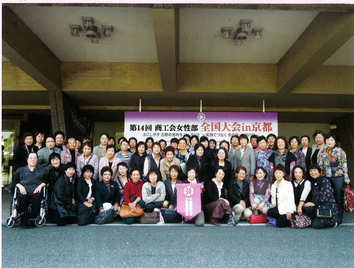
平成24年10月16日 全国大会会場前にて