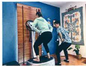
当院ではプロのアスリートも愛用する3次元振動マシン「パワープレート」を使用した短時間で効率的な効果が得られるトレーニングを提案します。