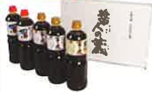
富士虎おすすすめセット