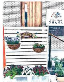
OHANAとはハワイ語で「家族」という意味。皆様を家族同様にケアしたい、院長のそんな思いが込められています。