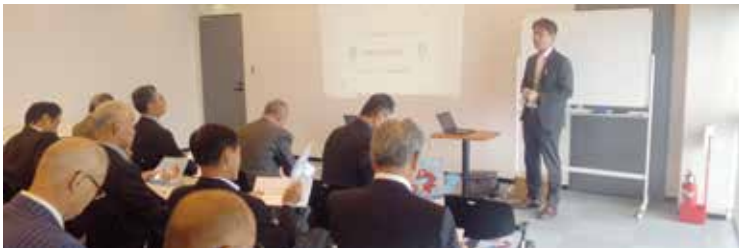
▲万博協会での研修の様子