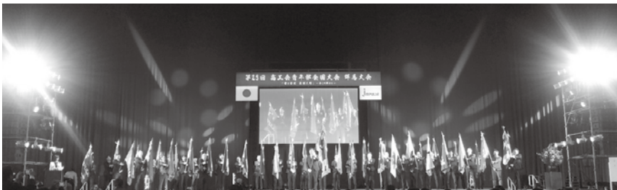
47都道府県青連会長 集合写真

令和5年11月15日～16日、群馬県（Gメッセ群馬）にて商工会青年部全国大会が開催されました。