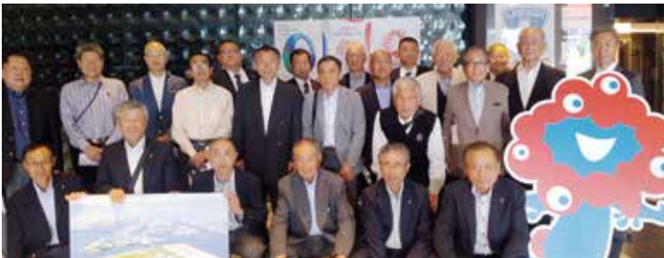
▲参加者の集合写真（大阪府庁前）

千葉県商工会連合会では、県内の商工会長を対象とした先進地視察、特に地域特性を生かしたビジネスモデルに取り組み商店街や地域振興、自然災害からの復興などをテーマに地域全体の健全な発展に資することを目的に研修を実施いたしました。 日程は令和5年10月24日（火）から25日（水）の2日間にわたり、総勢22名の商工会長等が参加し、1日目は「中小企業の街」として現在でも多くの商店が独自の工夫を凝らして商売をしている千日前商店街等を視察しました。 2日目は最先端のテクノロジーを駆使して2025年に開催される大阪・関西万博の事務局である日本国際博覧会協会（大阪府庁）を訪問し、中小・小規模事業者と万博の連携などについて研修を受けました。また、現地では万博に向けた新たな取り組みや会場工事の進捗状況なども視察いたしました。