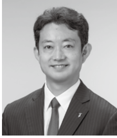
千葉県知事 熊谷 俊人